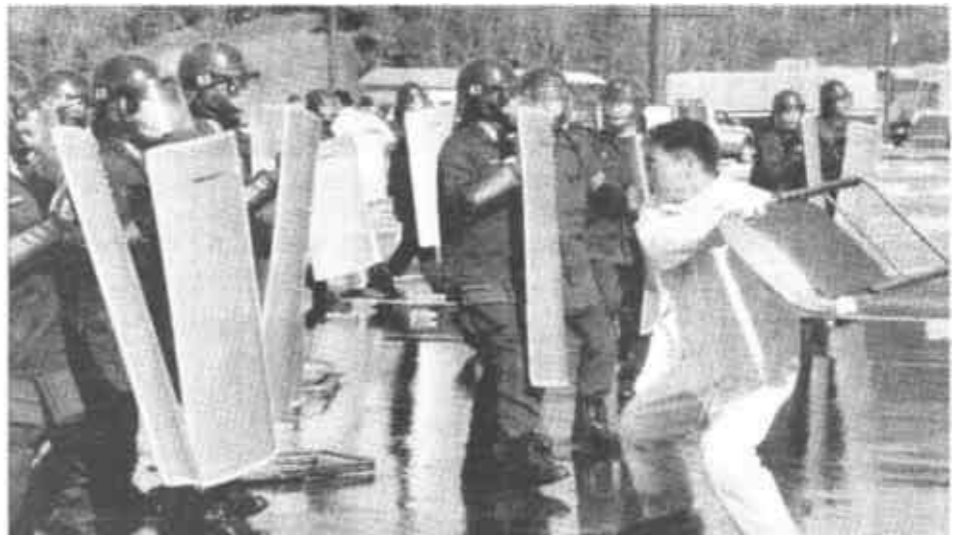
3月7日，在日本静冈举行的一次防暴演习中，一名“流氓”正将一把椅子砸向日本特警。静冈是日韩世界杯承办城市之一，近200名日本特警参加了本次旨在防止恐怖活动的演习。