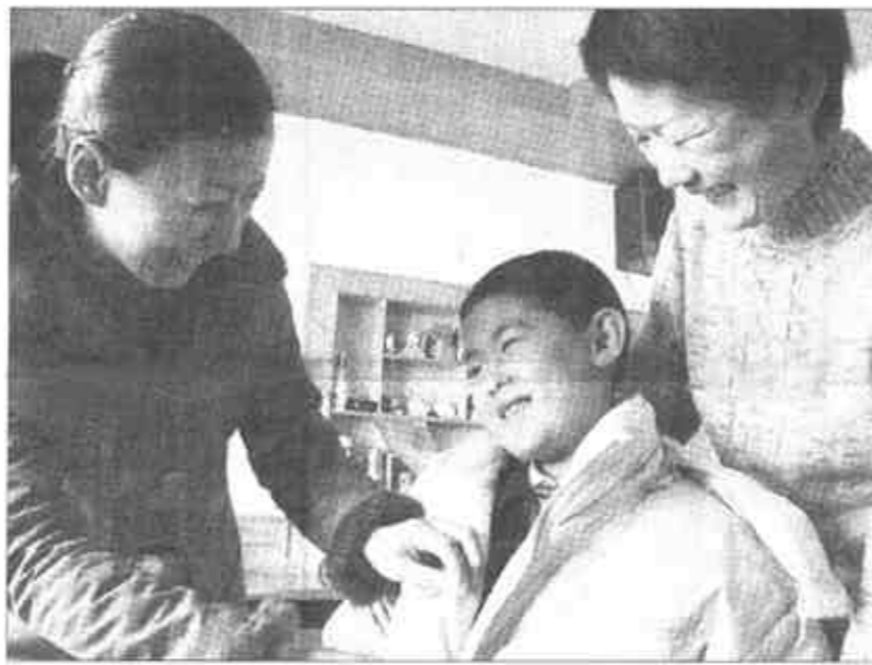
来自全国“两会”的报道

笔业务，时间快，效率高，很受企业欢迎。胜利油田工程建设一公司为实施同一项目要进口总价66.4万美元的设备。东营海关领导表示，一定会大力支持，以最快速度为企业提供最良好的服务，让企业满意。 (常文友 尹宪鹏)