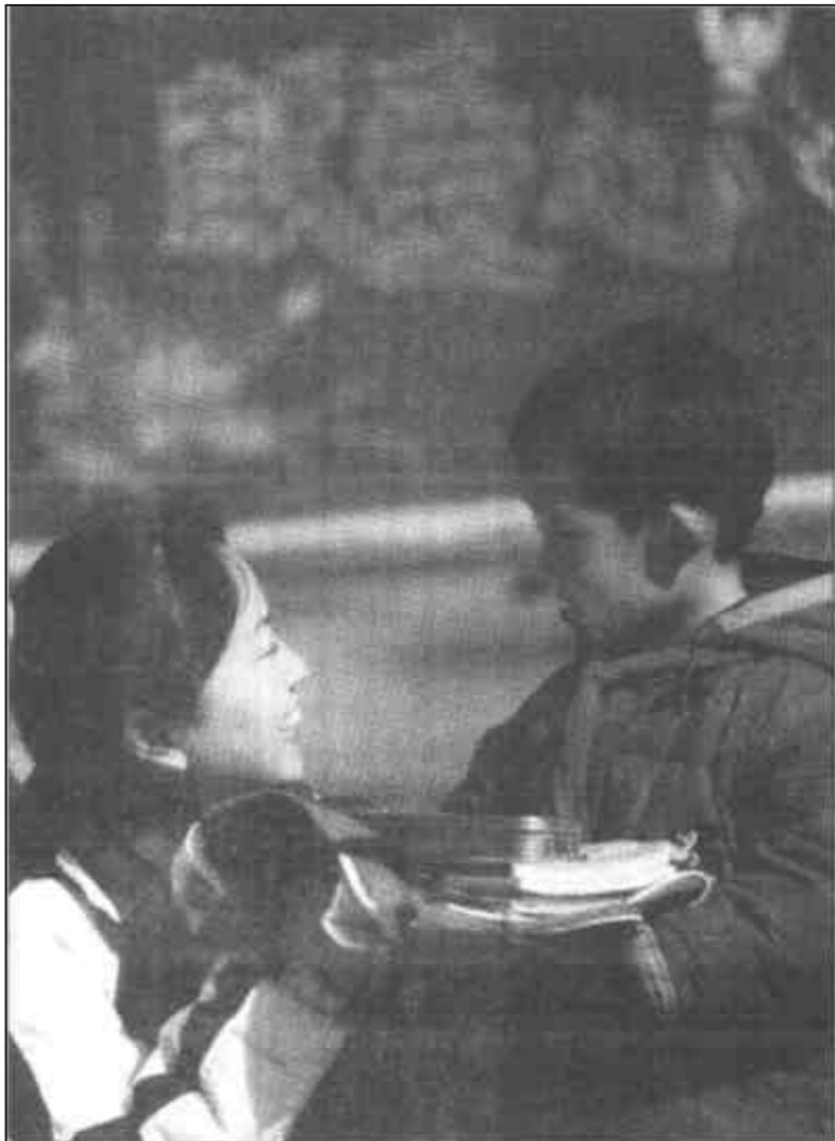
3月7日，南京市白下区八宝东街小学开展“三八”献爱心活动，女教师们捐出自己的节日补助，为12名特困生购买学习用品，鼓励他们好好学习。八宝东街小学学生多半为外来民工子弟，教师用自己的爱心努力在学生们幼稚的心田播下“读书、明理、做人、成才”的种子，让学生和家长感受到人与人之间的宝贵真情。

在“三八”国际劳动妇女节来临之际，重庆市3月7日举办了女性手工艺表演赛，参赛者各展绝活，展示现代女性的风采。图为15号选手张姝正在创作《相约春天》。