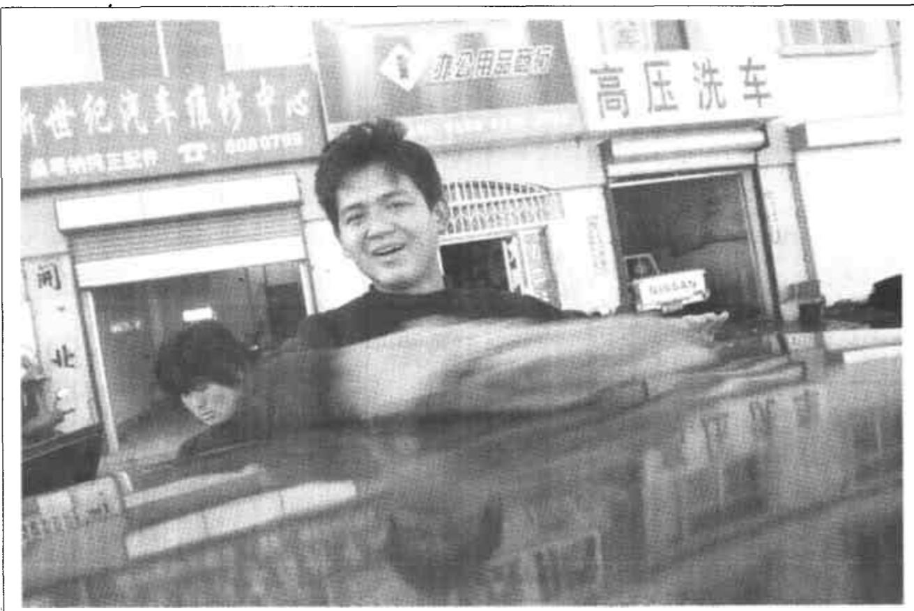
春节过后，油城的外地打工仔陆续返城。随着入世后的汽车降价，私家购车的增多，洗车业日渐火爆。这位外地打工的小伙对这份工作十分满意。

河口讯 人勤春来早，河口区上下掀起了抢春、忙春高潮。他们一是制定详细的生产方案。立足农业结构调整，将水产、冬枣、芦笋确定为重点发展产业。