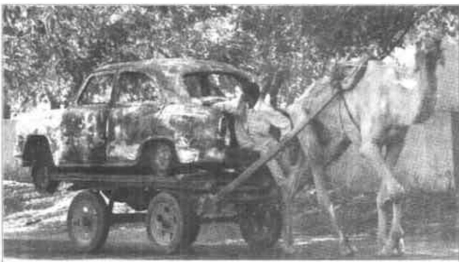
3月7日，在印度古杰拉特邦艾哈达巴德的街头，一个印度人赶着骆驼拉走一辆在种族冲突中被烧毁的汽车残壳。据悉，目前这里陆续又发现遇难者的尸体，冲突中死亡人数上升到665人。

根据授权，全国学位与研究生教育发展研究中心侧重国内文凭的认证，教育部留学服务中心侧重外国学位证书的认证。涉及外国学位与我国学位的对应关系，由两个机构进行协商，并由全国学位与研究生教育发展研究中心组织评估后提出咨询意见。