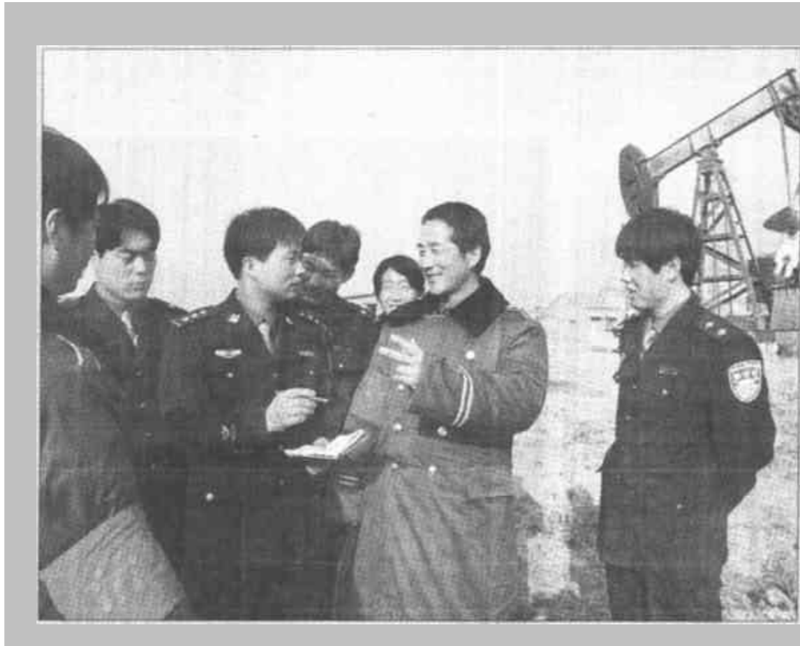
广饶县花官乡为确保村居、油区治安稳定，由派出所牵头，帮助各村成立了治安巡逻队...